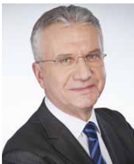
ministar zdravlja prof. dr. sc. Rajko Ostojić, dr. med.

„Sreća je kao zdravlje – ako ga ne primjećuješ, znači da ga imaš“, velika je životna istina koje često nismo svjesni. Zaista, čovjek kad je zdrav ne razmišlja o bolesti. I to je dobro.